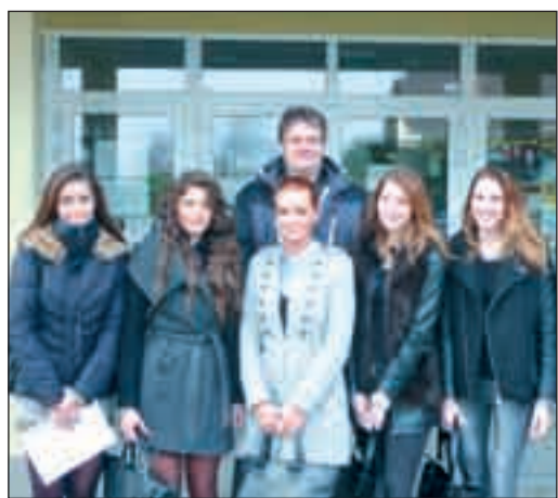
A Gárdonyi előtt a lányok és a főszerzők

Eljött az utolsó hét és szombat este kiderül, ki lesz a legszebb lány Érden! Addig még kiosztottak pár almát a gyerekeknek, megtesznek jó néhány lépést a kifutón, a többi a zsűrin múlik... Az I. Érd Szépe november 30-i gálájára készülhetnek a nézők is, akik együtt akarnak vacsorázni a Finta-rendezvényházban a csinos estélyis, bikinis hölgyekkel, és egy igazi koronázást akarnak megtekinteni.